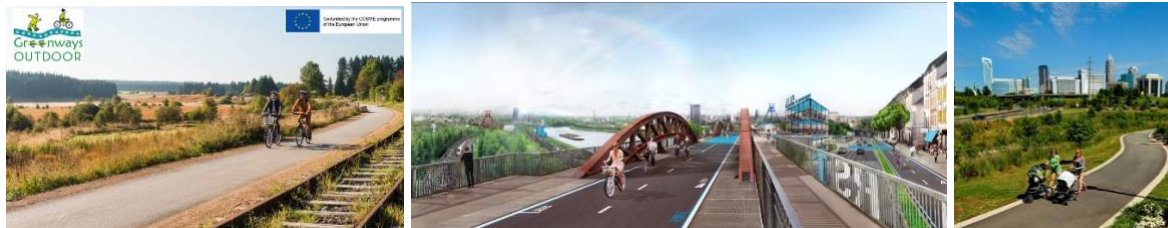
Примери зелених стаза, тунел из Јужне Кореје и појединих жел. станица