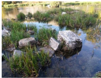
Остаци старог моста