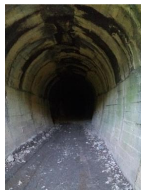
Прилаз тунелу из Невесињске улице